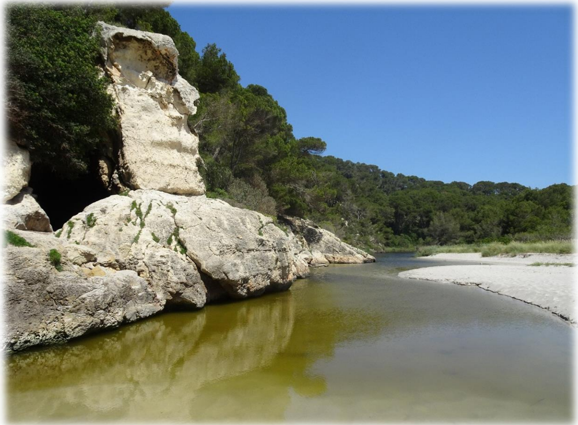
Een van de belangrijkste kenmerken in de baai van Trebaluger is het riviertje dat uitmondt in de zee.