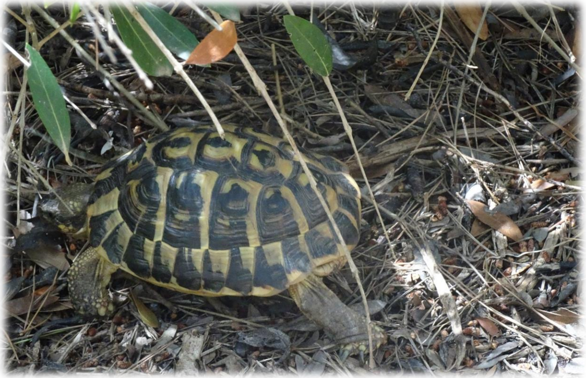
De Griekse landschildpad, ongeveer 30 cm. Hoe ouder de dieren worden hoe meer de lichtere kleuren vervagen. Een volwassen exemplaar kan twee tot drie kg wegen.