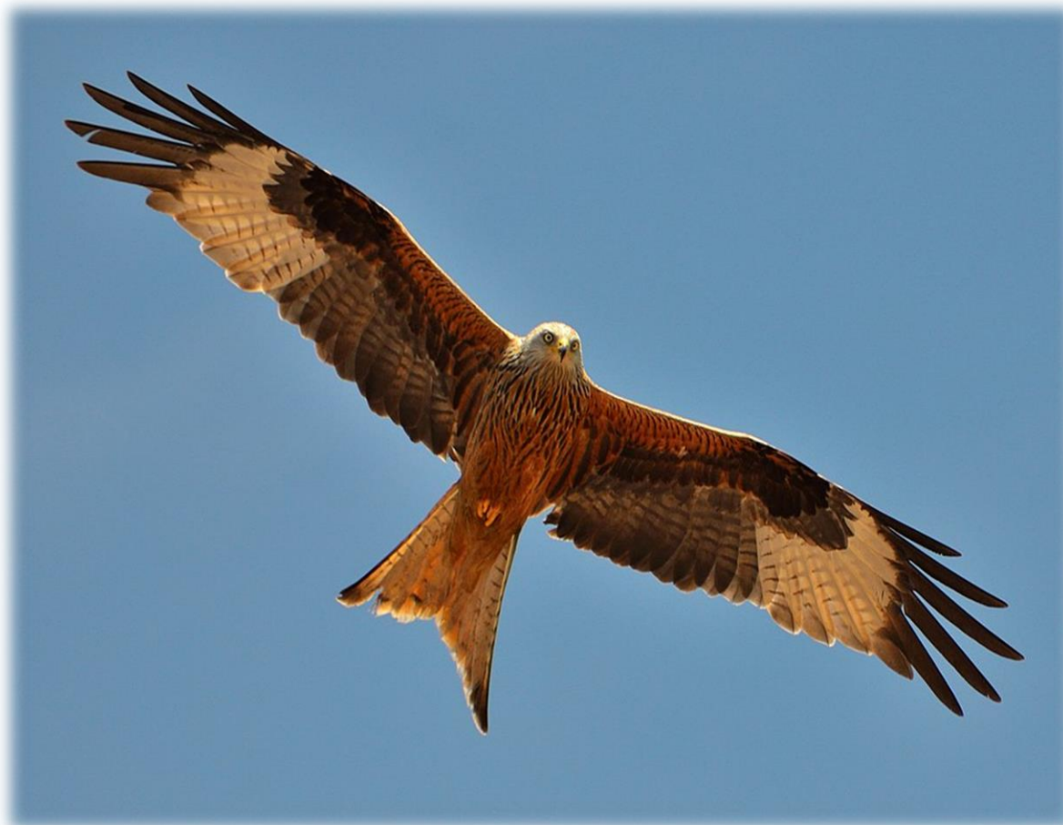
De rode wauw op zoek naar een prooi. Een volwassen exemplaar is circa 62 centimeter groot, weegt 750 tot 1000 gram en heeft een spanwijdte van ongeveer 160 cm.